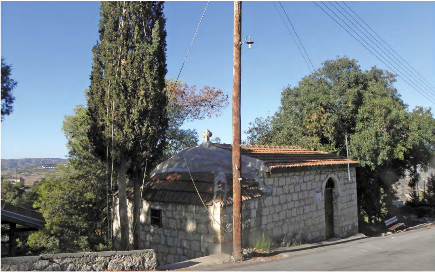
▲ Ξωκλήσι αφιερωμένο στον Αρχάγγελο Μιχαήλ