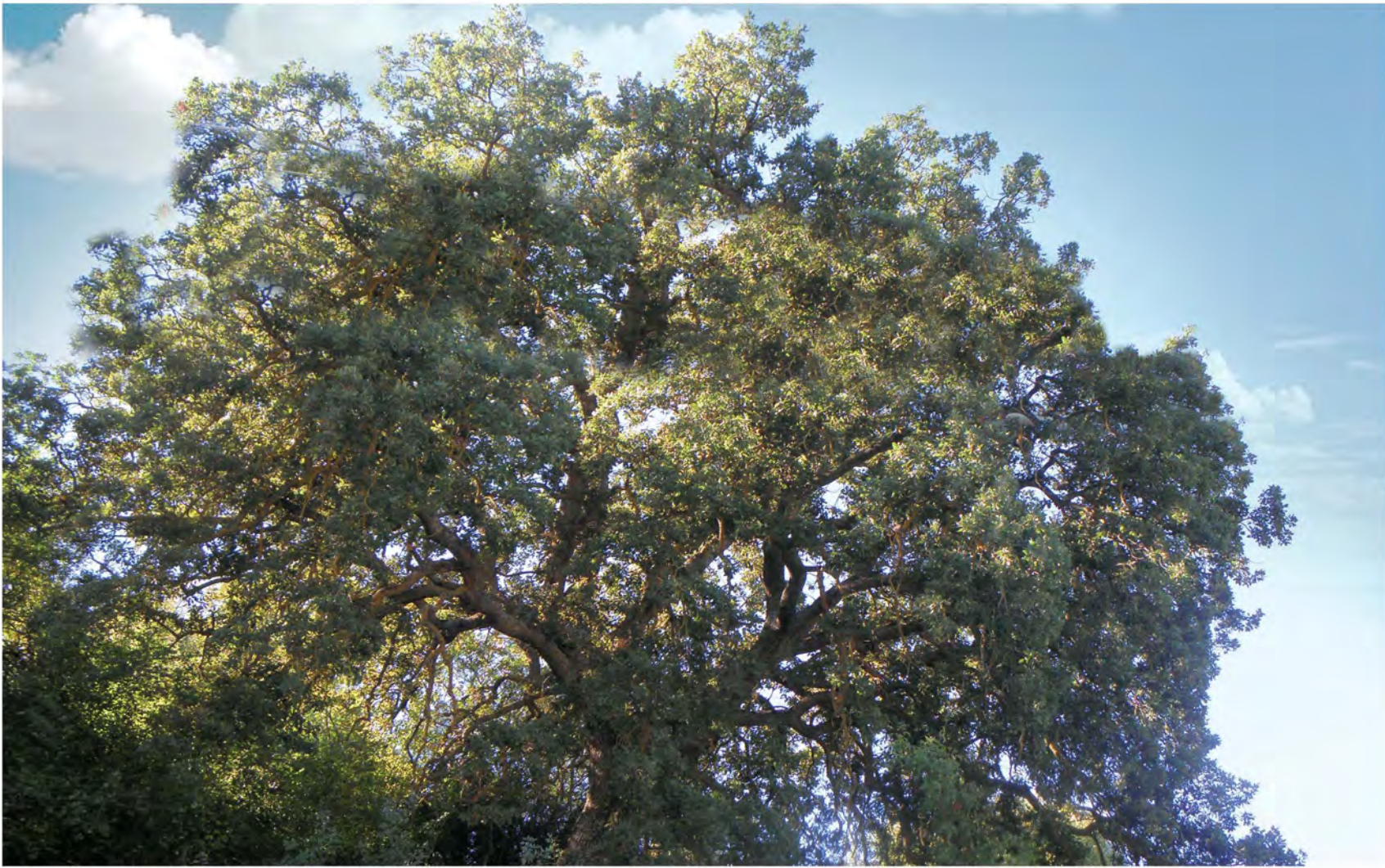
▲ Αιωνόβιος δρυς