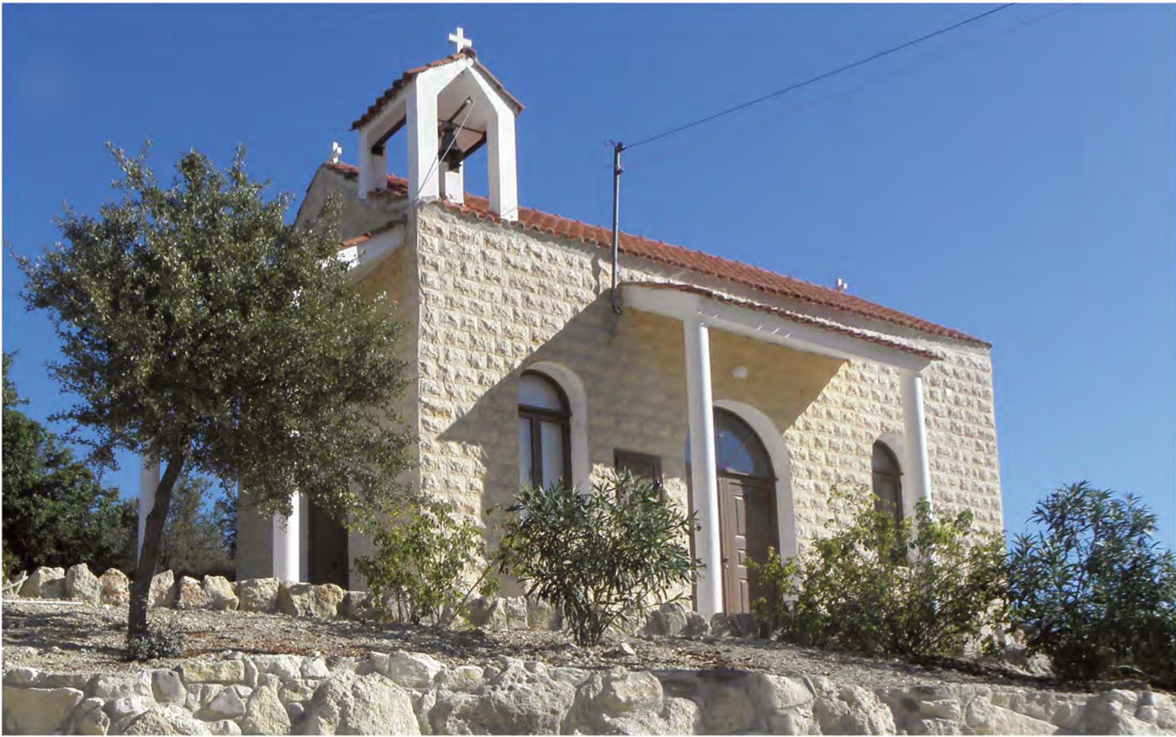
▲ Εκκλησία Παναγίας Φανερωμένης