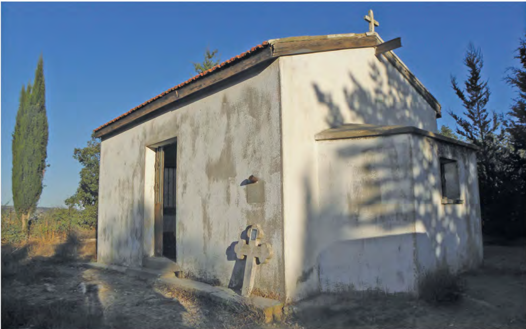
▲ Εκκλησάκι Αγίου Γεωργίου