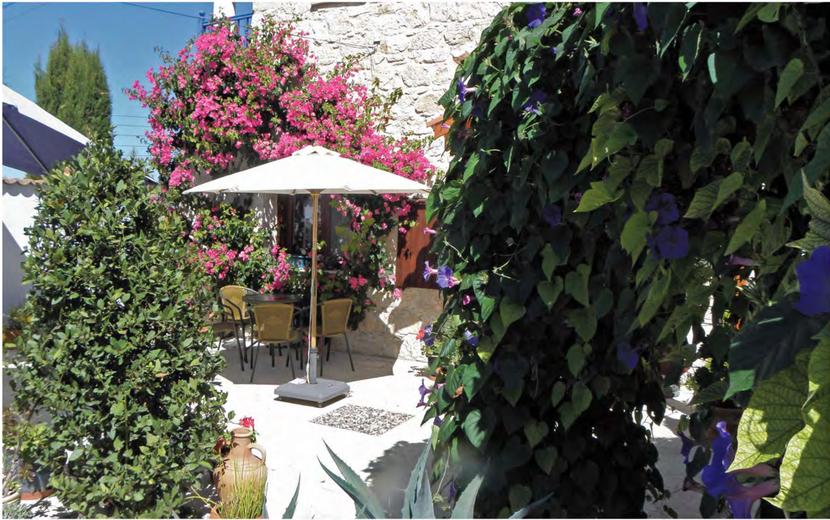
▲ Περιποιημένη αυλή με πολύχρωμα λουλούδια