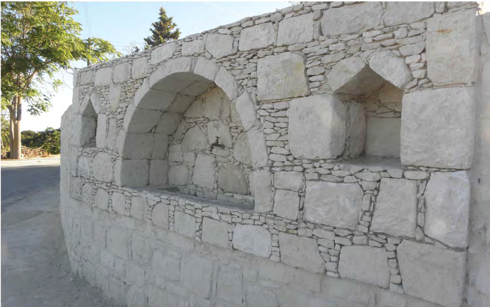
▲ Μια πετρόκτιστη βρύση που αναπαλαιώθηκε στο πλαίσιο των αναπτυξιακών έργων της κοινότητας