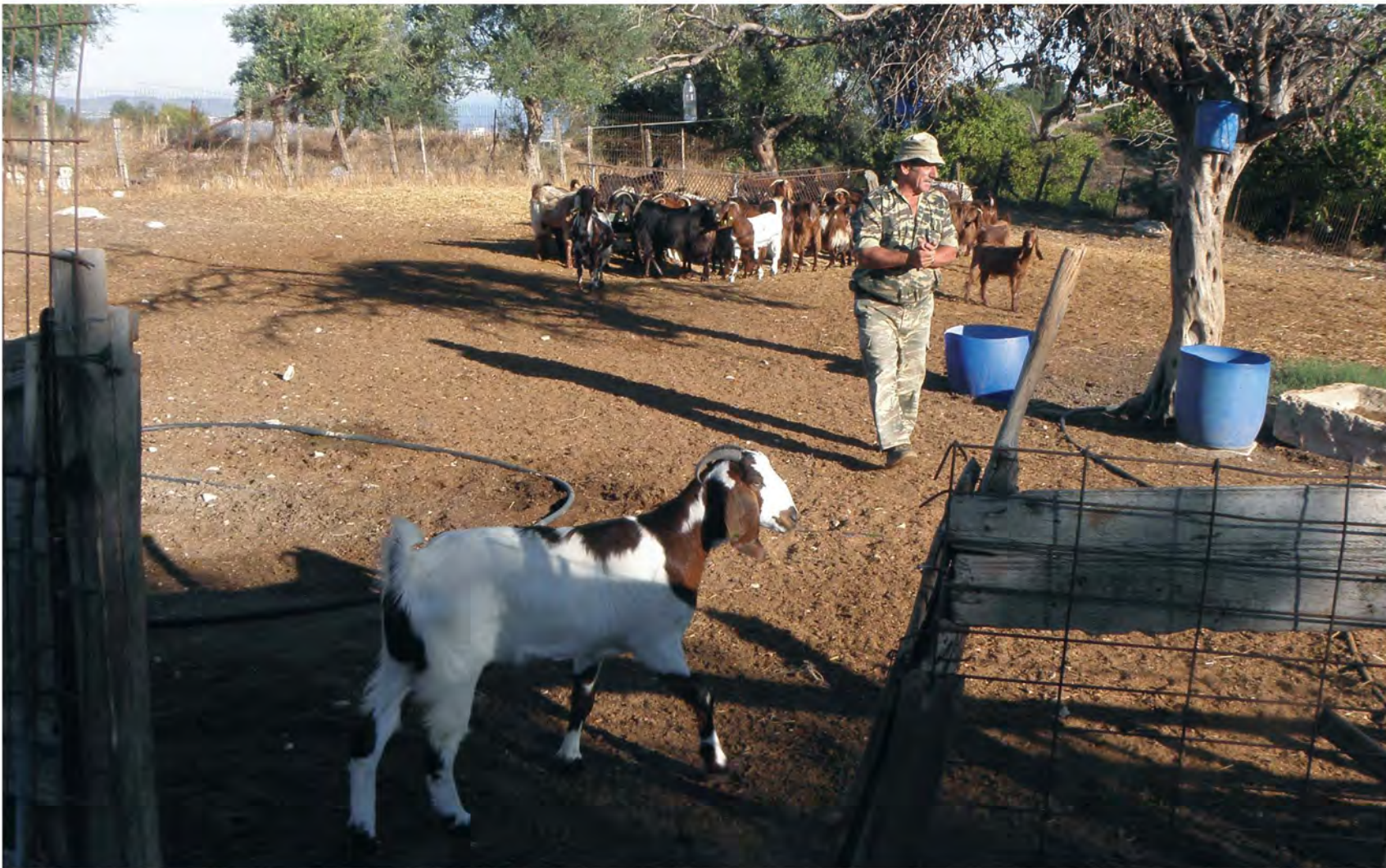
▲ Η ενασχόληση των κατοίκων με την κτηνοτροφία