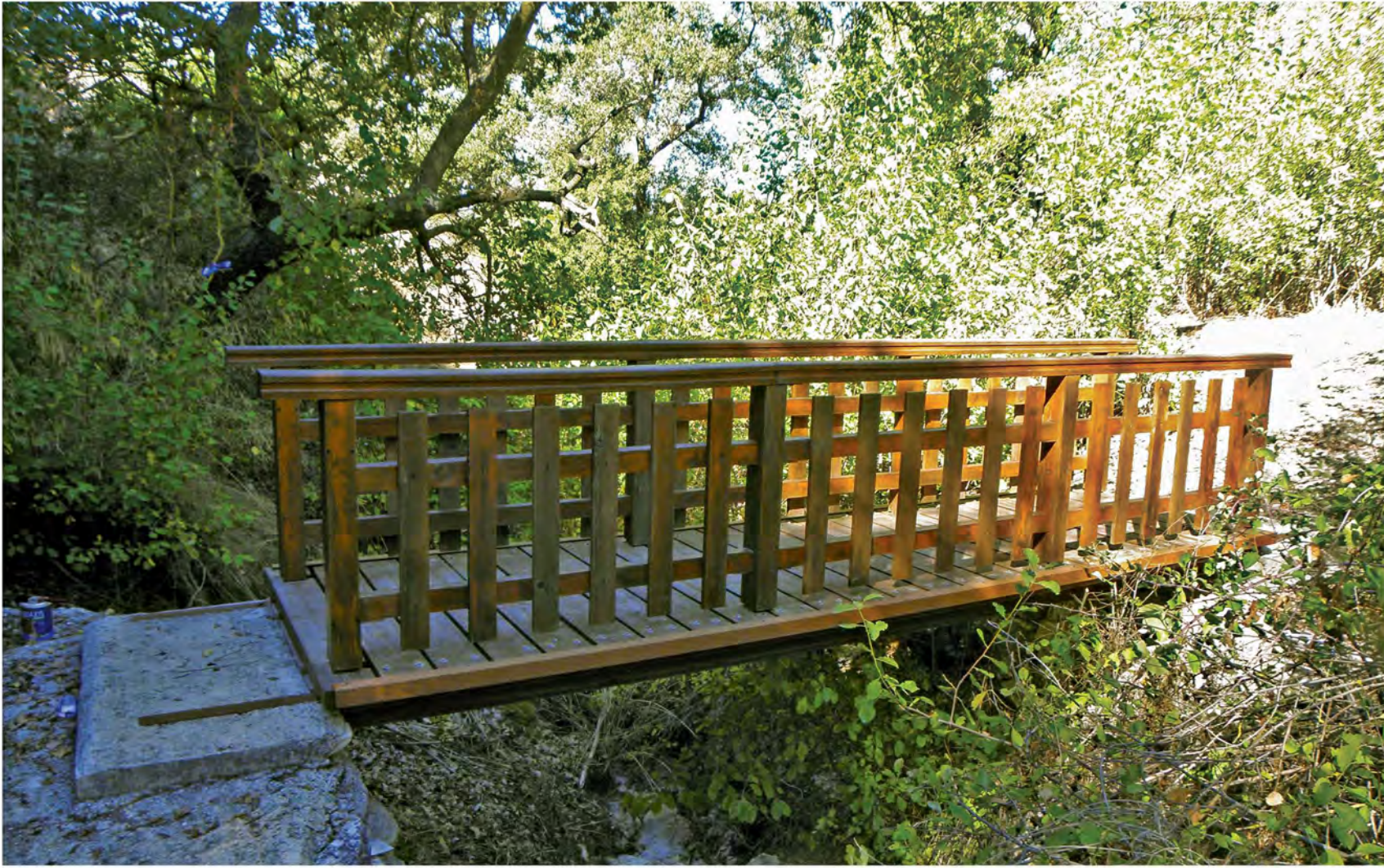
▲ Το ξύλινο γεφύρι στο Μονοπάτι της Φύσης