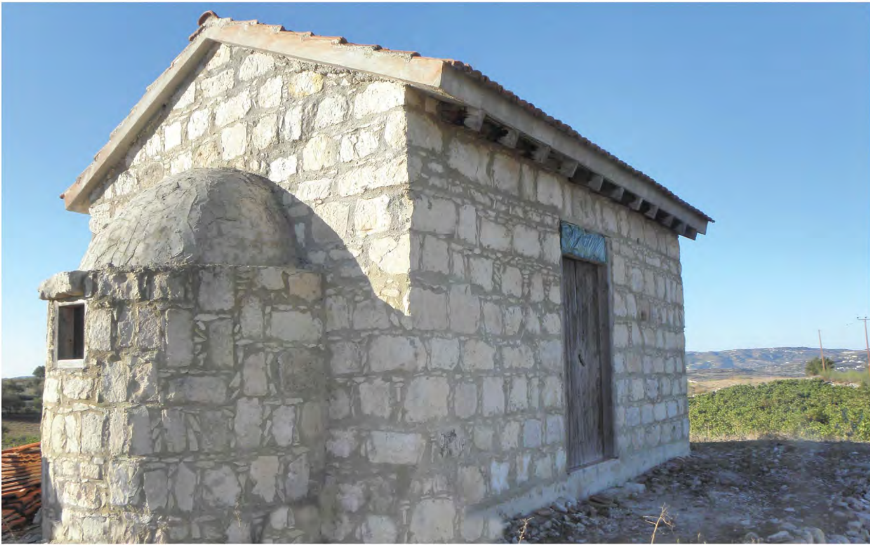
▲ Εκκλησία Αγίας Μαρίας