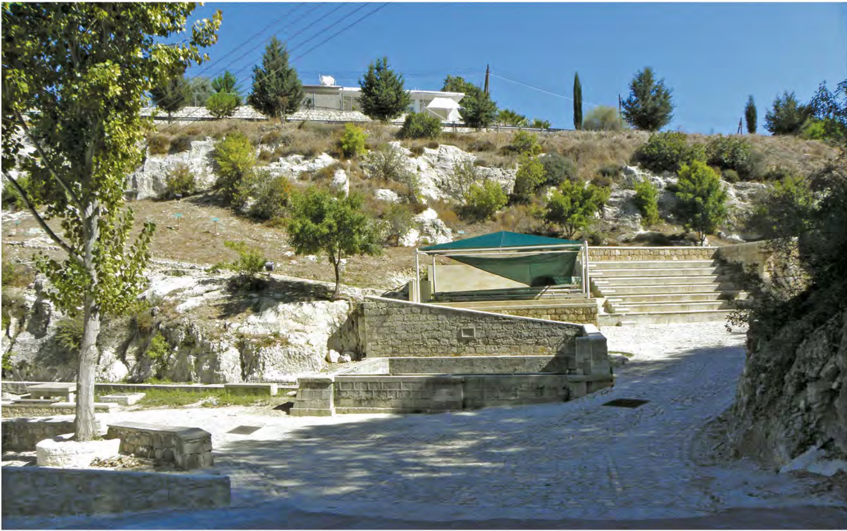
▲ Ο όμορφα διαμορφωμένος χώρος εκδηλώσεων