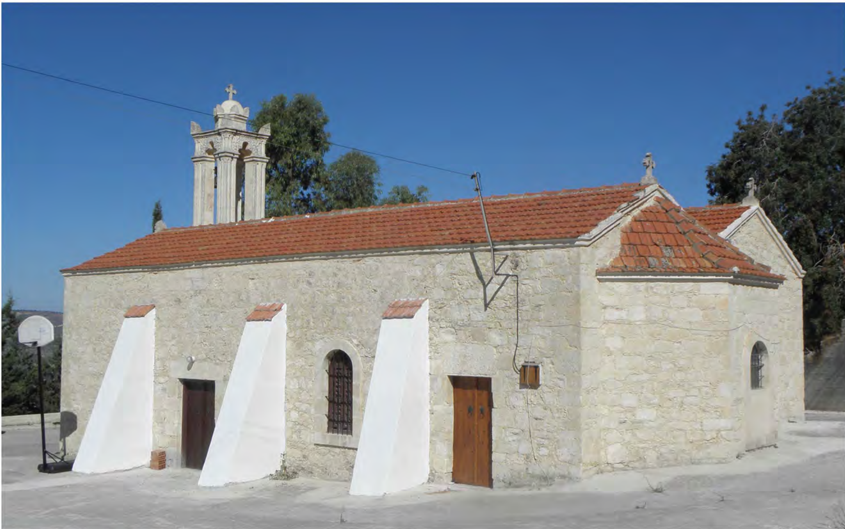
▲ Εκκλησία του Σωτήρος