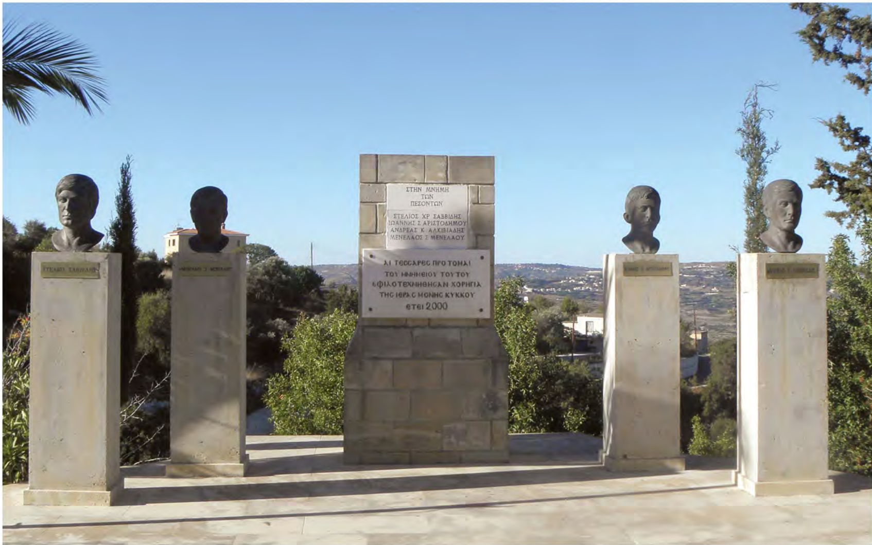
▲ Μνημείο Ηρώων